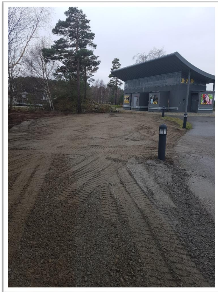
Ferdig planert tomt til ny sikkerhetshall

Da Samferdselsdepartementet utlyste midler til lokale trafikksikkerhetstiltak sendte vi inn en søknad om midler til en egen sikkerhetshall som vi kunne sette opp i nærheten av Trafoen. Vi fikk innvilget søknaden og fikk tildelt kr 500 000,-. Skantraf ga oss mulighet til å sette opp et midlertidig brakkebygg ved siden av Trafoen. Skantraf har tatt kostnadene til planering og Eiendomsselskapet hjalp oss med søknaden og utgiftene til søknaden til kommunen. Vi har også bestilt en ny bråstans til å ha inni bygget. Den nye sikkerhetshallen håper vi står ferdig i slutten av januar 2019.