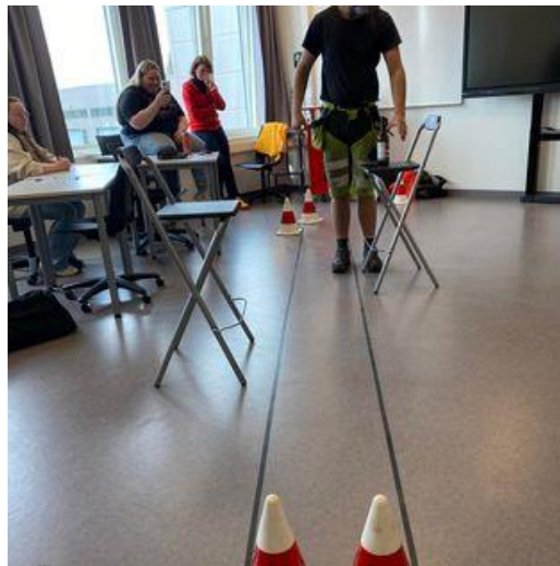
Promillebriller på Sam Eide videregående skole

TS-ambassadørene på flere av skolene velger å lage egne TS-dager hvor hele eller deler av skolen deltar. Vi har i år vært på TS-dag i Søgne, Risør, Lista og KKG. Opplegget vi kjører har variert etter hvor store gruppene er og hvor lang tid vi har, men det viktigste for oss er at elevene blir utfordret til å tenke litt, reflektere rundt egen atferd og bli litt mer bevisst på risiko i trafikken.