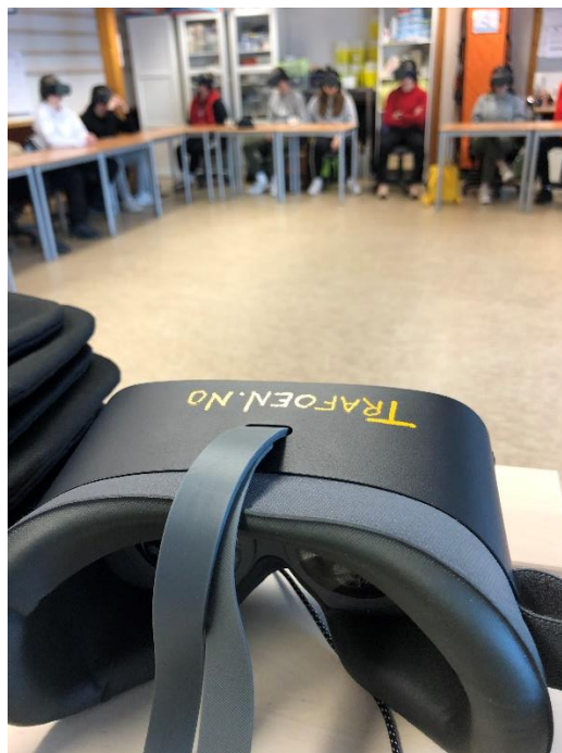
VR brille brukt i klasse

VR-brillene ble tatt i bruk første gang våren 2020. Midlene til VR-formatet av Trafoen fikk vi gjennom søknad om nasjonale midler. Ønsket med VR-brillene er å kunne ta Trafoen med oss ut til grupper som ikke har mulighet til å komme til Trafoen. I VR-brillene er filmene i Trafoen satt sammen til en film som varer i 14 minutter. Ved hjelp av VR teknologien har deltakerne mulighet til å se handlingen fra alle vinkler. VR-brillene kan vi bruke på større grupper enn vi har i Trafoen. Men fordi vi ønsker å være tro mot Trafo-konseptet hvor små grupper er viktig, så har vi bestemt at maks antall i en gruppe kan være 15 personer. Da må vi i tillegg ha minst 2-3 timer, da det er viktig at alle skal bli hørt og sett.