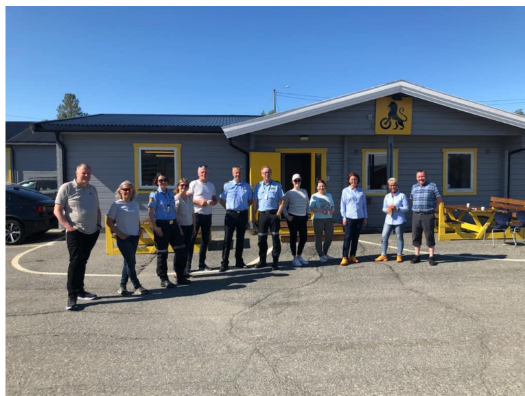
Besøk hos NAF Alta, juni-22

NAF i samarbeid med konfliktrådet i Alta valgte deretter på oppfordring fra oss å søke midler hos Samferdselsdepartementet. De ønsket midler til VR-briller og opplæring, slik at konsept og metoder blir likt Trafoen. Midlene fikk de, og i begynnelsen av juni dro vi opp til Alta i 3 dager hvor vi fikk vist frem VR-briller og konsept til både politi, ungdomscoordinatorer, kommuneansatte og administrasjonen i Troms og Finnmark fylkeskommune.